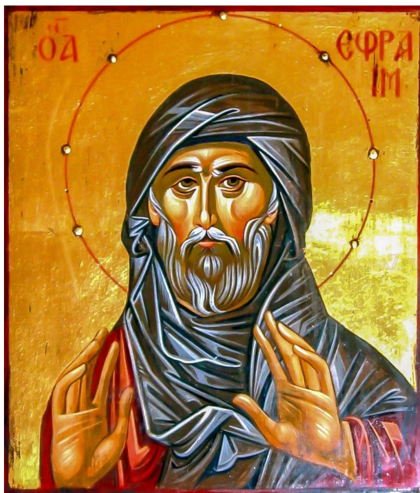
преподобный Ефрем Сирин О молитве