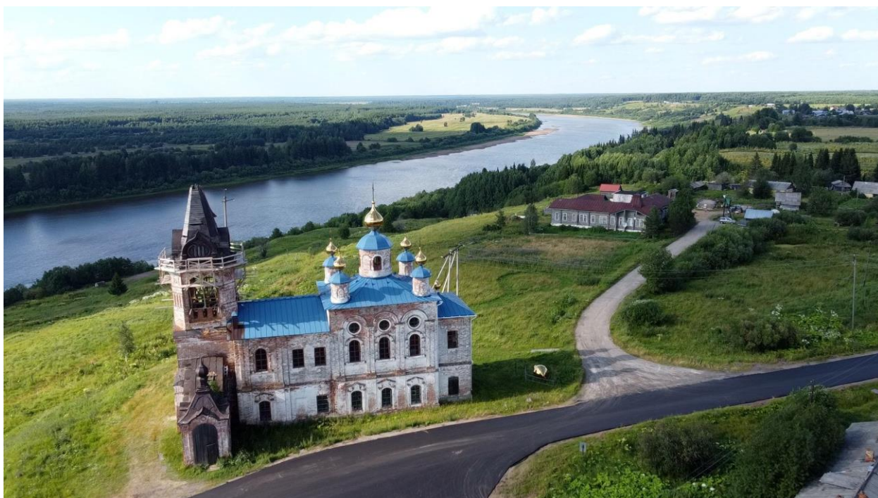
Село Онежье на реке Вымь (современный вид)

И кстати сказать в Малой Коквице в Переписной книге...1710 года о Щ(ч)ановых записей нет!