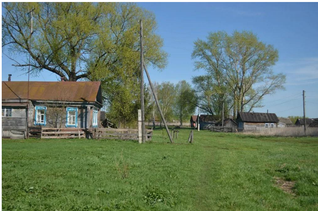
Деревня София, неподалеку от села Большой Вьяс (современный вид; ныне Лунинский район Пензенской области).