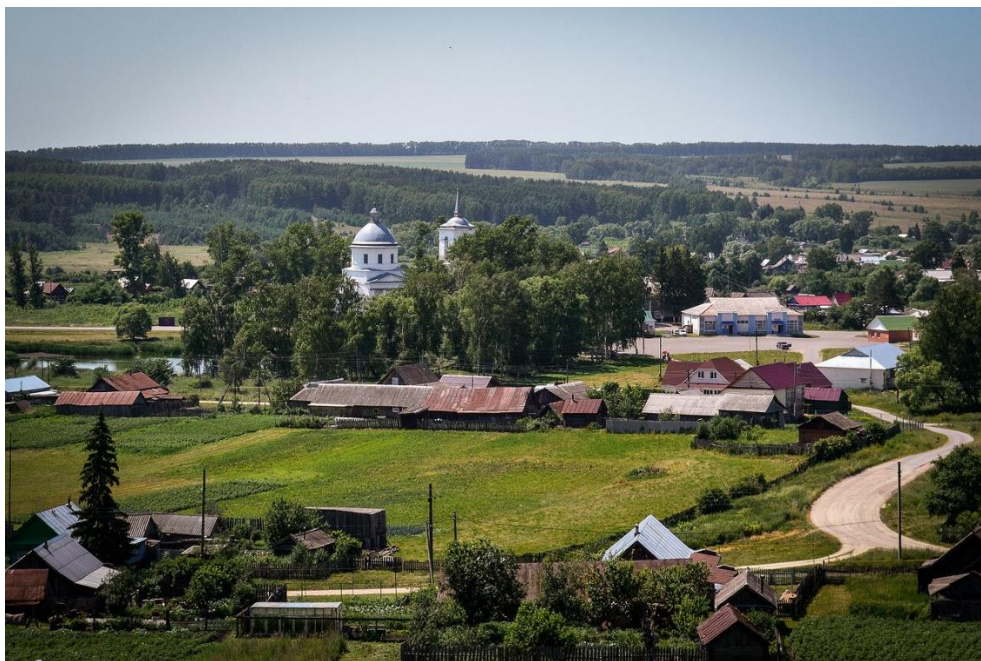
Село Большой Вьяс (современный вид; Пензенская область)